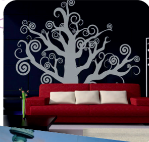
Stand Feria Hábitat Valencia